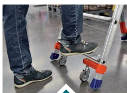
Dès la montée de l'opérateur, la plate-forme prend appui sur ses 4 patins.