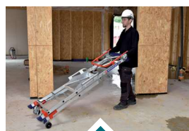
2 roues de déplacement pour déplacer le Wheelys plié.