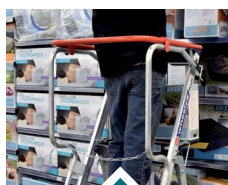
Protection 360° de l'opérateur.