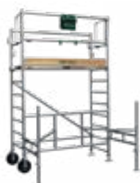
H. plancher 2,00 m H. de taille 3,00 m Code promo 19.063