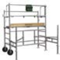
H. plancher 1,25 m H. de taille 2,25 m Code promo 19.062