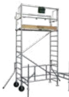
H. plancher 2,75 m H. de taille 3,75 m Code promo 19.064