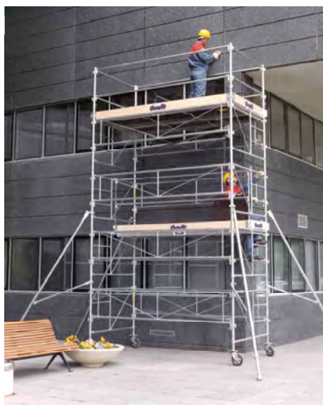
GALAXY 45 - Hauteur de travail 6,50 m

↑ H. travail maxi : 12 m ↔ Galaxy 45 : 1,50 m x 3 m ↔ Galaxy 90 : 3 m x 3 m