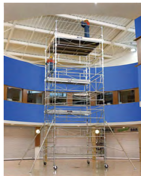
GALAXY 90 - Hauteur de travail 9,80 m