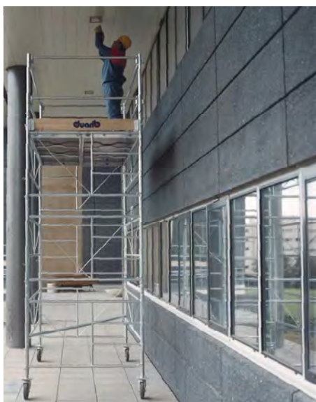
GALAXY 45 - Hauteur de travail 5,40 m