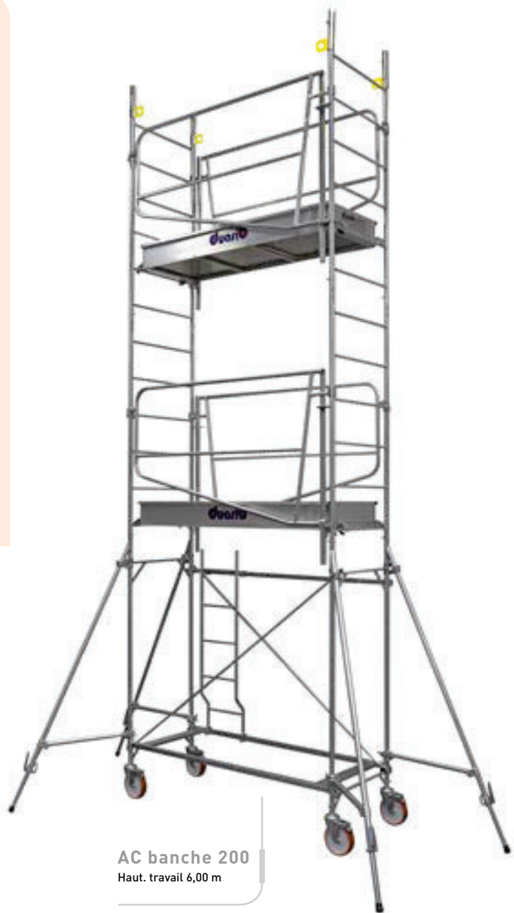
AC banche 200 Haut. travail 6,00 m