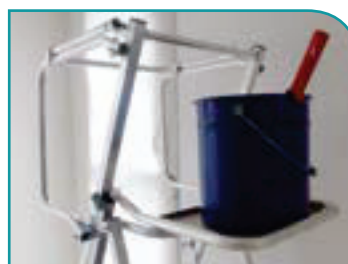
OPTION : tablette peinture pour fût 15 L.