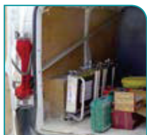
Hyper pliable pour un encombrement mini.