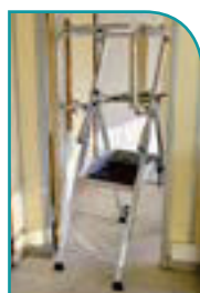
Passes les portes de 0,63 m.