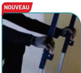
NOUVEAU Réglage de la hauteur + facile, + intuitif et + durable. BREVETÉ