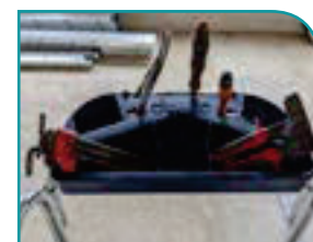
Tablette multifonctions grande capacité (30 Kg), porte-outils et adaptée pour fût de 15 L.