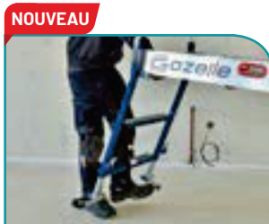
NOUVEAU Stabilisateurs rabattables au pied + pratiques et + rapides à mettre en place. BREVETÉ