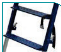
Accès par larges marches avec antidérapant puissant.