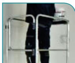
Garde-corps avec portillon pour une protection permanente et incontournable. BREVETÉ