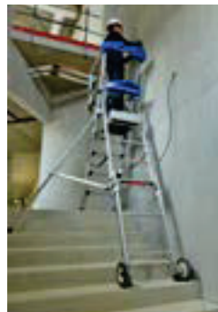
Installation en dénivelés.