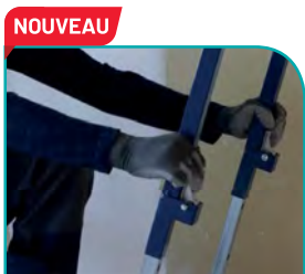
NOUVEAU Réglage de la hauteur + facile, + intuitif et + durable. BREVÉTÉ