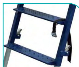
Accès par larges marches avec antidérapant puissant.