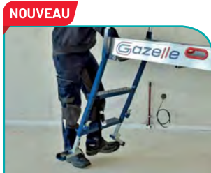
NOUVEAU Stabilisateurs rabattables au pied + pratiques et + rapides à mettre en place. BREVÉTÉ