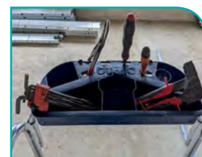
Tablette multifonctions grande capacité (30 Kg), porte-outils et adaptée pour fût de 15 L.