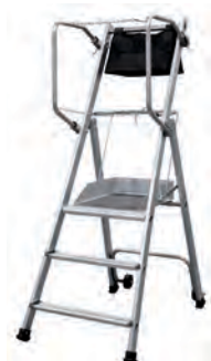
T.REX - 3 MARCHES H. travail maxi : 2,70 m