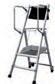
T.REX - 2 MARCHES H. travail maxi : 2,50 m