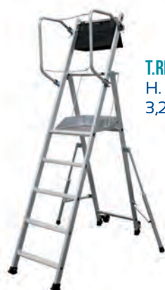
T.REX - 5 MARCHES H. travail maxi : 3,20 m